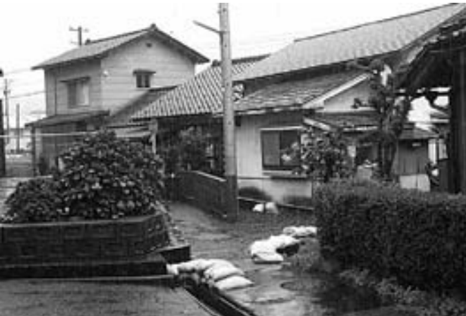
浸水世帯（東古市地区）

問 町内には常習的に浸水する世帯がある。 例えば、東古市区の永平寺口駅西方の低地だ。8月18～19日までの雨でも2世帯が床下浸水した。諏訪間区でもあったが、現実的に浸水で困っており、町民が安心して暮らせるよう早急に対処することが肝要だ。