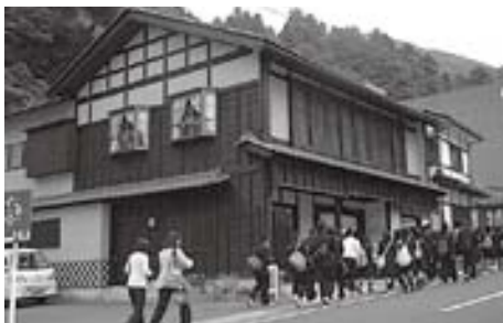
門前地区にぎわい創設事業

また、8月18・19日の豪雨による永平寺町内の状況と今後の復旧について、委員より質問意見がありました。