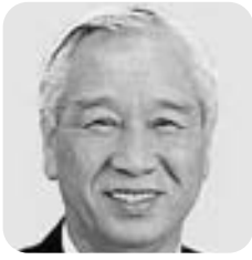
伊藤 博夫 議員