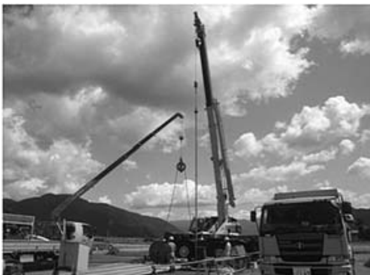
永平寺温泉楊湯工事

問 どのような基準で実施・評価しているのか 企画財政課長 各団体等の補助金については、事業計画・契約締結に基づいて適正に実施しています。実績報告は受けています。