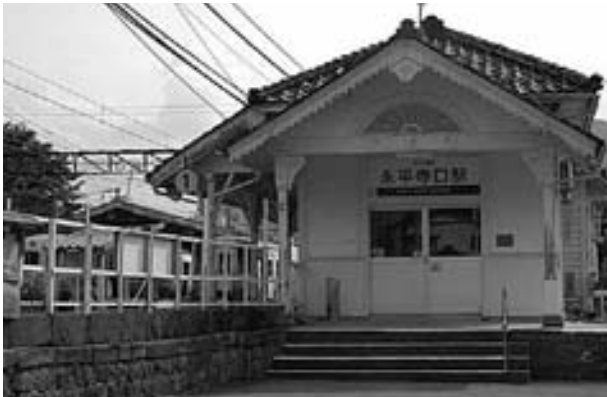
えちぜん鉄道（永平寺口駅）

問 えち鉄の来年度以降の行政支援スキームを検討する「活性化連携協議会」が公表した「地域公共交通総合連携計画」の素案は、「平成24年度から今後10年間の沿線市町の経営支援は、従来の経営赤字の補てんから、鉄道（社会資本）の維持に必要な経費（線路電路保存費）約22億円とする。」であった。 町長 えち鉄支援は、平成14年度から今年度も含めると10年間、俗に言う赤字補てんで総額約4億4千万円 本町負担分は、その18%とすると、10年間で約4億円、年間約4千万円程度で、最近5年間の本町補助額平均3千5百万円と比較すると、若干の負担増になるのではないのか。