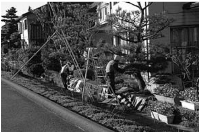
シルバー人材センター 庭木剪定