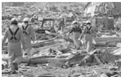
陸前高田市の被災状況

義であり、納税者の皆さ んに対して不公平が生じ ないよう万全を尽くして まいります。