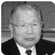
渡辺 善春 議員