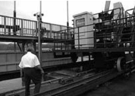
手取川七ヶ用水小水力発電

問 原子力発電所の安全性が確保できない以上、原子力発電への依存を少なくして、農業用水を利用した小水力発電への取り組みの検討をお願いします。