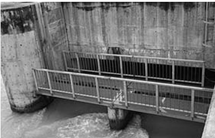
手取川七ヶ用水小水力発電

問 この間、主要事業に着手は予算計上もあることから分かるが、事業の途中の経過報告もなく、いきなり計画変更や事故繰越との予算計上は異常だ。 企画財政課長 誤解があったかも知れませんが、永平寺口開発など、今当初予算では用地買収等、準備段階の費用を計上しており、工事着工は24年度です。