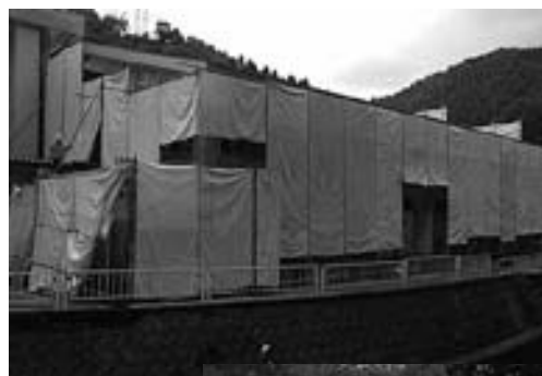
志比南小学校耐震工事

問 本町の耐震化率は、昨年度末で68・4%、震度6強で倒壊の危険が高いEとDランクはすべて完了しているが、残りCランクはいつまで完了できるのか。 町長 Cランクの残りは今年度末で9棟です。来年度は5棟を検討していますので、最後の4棟は平成25年度中には完了したいと思っています。