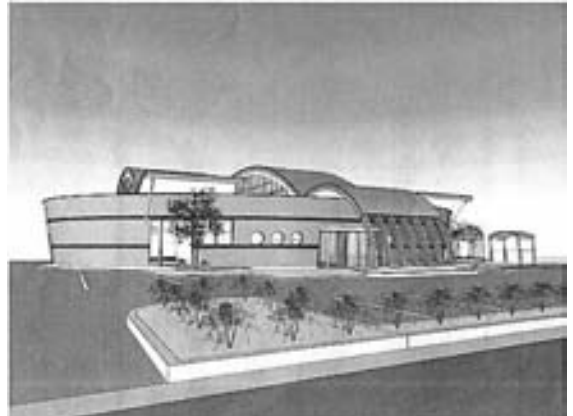
健康福祉施設の完成イメージ図

問 健康福祉施設の設計、運営事業の優先交渉権者が選定されました。地域の活性化、集客に関してどのような提案がありましたか。 健康施設室長 地元の種類団体との連携による地産地消、10人以上の団体の送迎バス運行、永平寺・恐竜博物館等の観光施設からの集客の提案がされています。 問 地域の活性化、集客に、町も積極的に取り組まなければなりません。すでに今回の一般質問で取り上げられた道の駅の