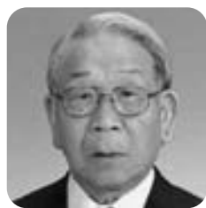
酒井 要 議員