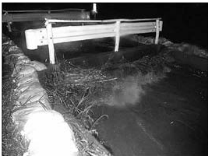
河内川の増水状況

建設課長 毎年多くのご要望をお聞きしております。町といたしましては、基本的にご要望にお応えをしたいというふうな考えをしております。ただし、それらの実現のためには相当の予算も必要になります。また、1年間では対応できないようなものではないかと。そういったことから要望に対しては十分検討し、実施に向けているところで