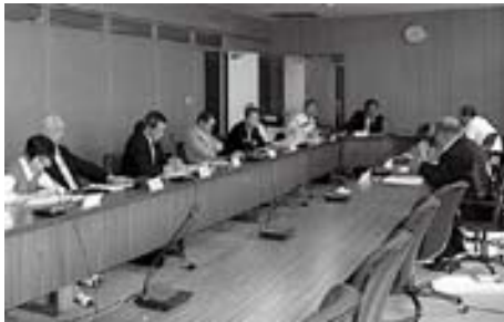
消防署統合推進特別委員会