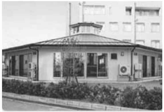
愛育ちびっこハウス（後ろは愛育病院）

子育て支援課長 越前市で保育所がそうした施設を作りましたが、財政面・人材・来園者数のばらつきなど、実際の経営は難しいみたいで施設は無くなりました。