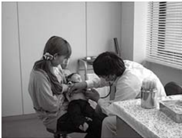
予防接種の診察風景

さらに、「公民館活動の視察から、社会教育主事の有資格者を各公民館に配置することが、公民館事務局の強化、地域活動発展の要」、「町保健師の活動内容の検証と、町民の健康づくりでの力の発揮を」、「学校への太陽光発電の設置はされが、教育への利用と状況報告を、また他の自然エネルギー利用も考えてはどうか」などの質問が出され、それぞれ論議されました。