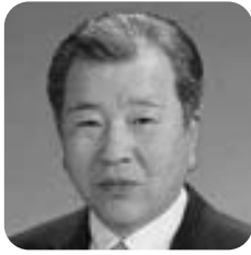
多田 憲治 議員