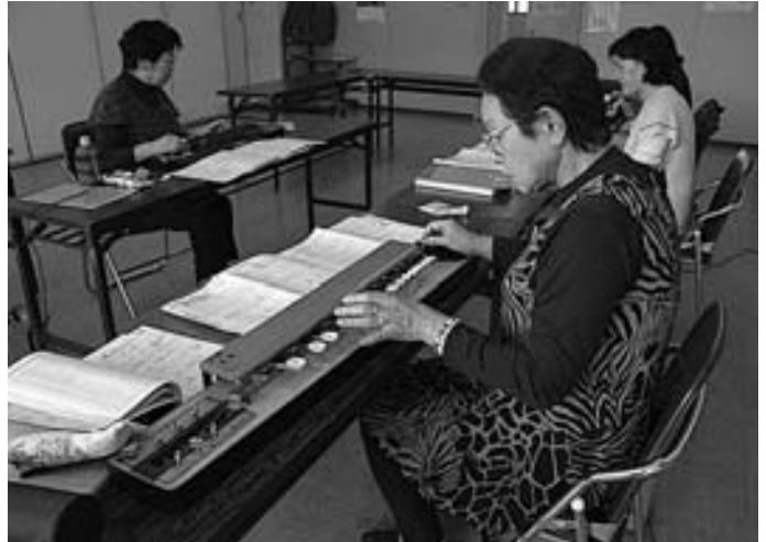
公民館講座 大正琴クラブ

問 地域には、それぞれ課題がある。町長はよく表明している。それは、それぞれの地域の振興や課題の整理、取り組みは区長会だけでできるものではないと思っている。人口減や流出、少子高齢化などの課題がありながら、地域振興と名の付いた組織は数地区しかなく、それらも地域の課題に恒常的に対応できる組織にはなっていないようだ。