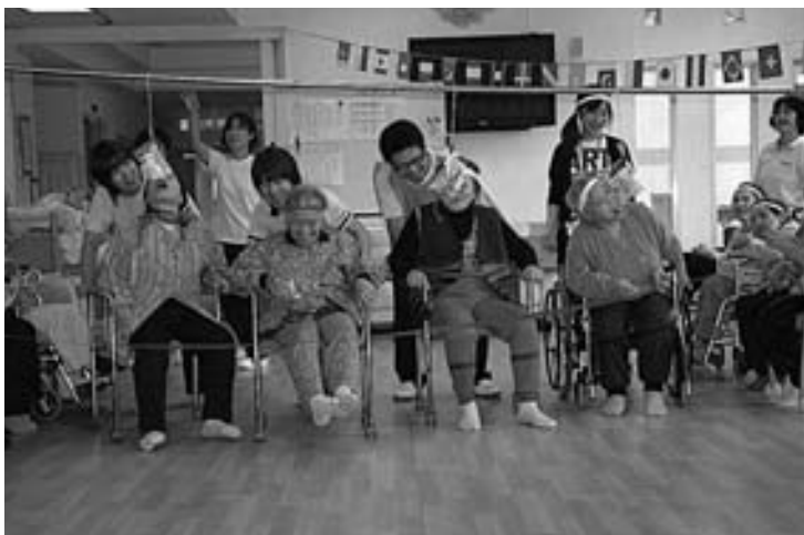
デイサービスの行事

問 町内におけるデイサービス事業の利用状況は、どのような状況なのか。利用日数が制限されている等々や利用したいがいない人がいるのかどうか、その現状をお伺いいたします。 あわせて、 国の法改正や利用者のニーズ等、これからのデイサービス事業の課題というか、その考え・あり方等について、お伺いいたします。 福祉保健課長 現状では、利用者の方が定員オーバーで利用できないという状況ではないと考えております。また、苦情のほうも現在は聞いておりません。 これからの介護サービス事業は、施設介護から在宅福祉事業が中心にな