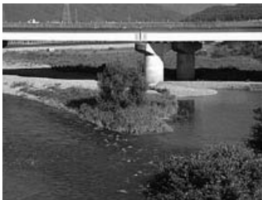
九頭竜川中州の木立

で、松岡公園整備事業の中で以前のからの要望であつた松平昌勝公墓所の整備をどの様に移転し、整備されるのかお尋ねします。 建設課長 松平昌勝公墓所の移転については、現在具体的な議論はされていませんが、ただ地権者等の説明会の席上このような意見も伺っております。今後関係者、学識経験者の意見を聞き、移転の検討も考えていきたいと存じます。