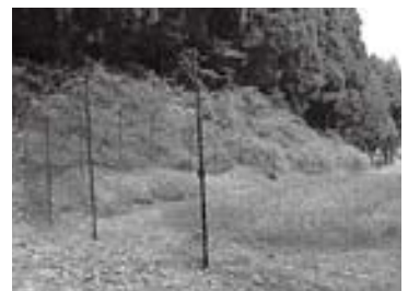
有害鳥獣ネット柵

伺います。 農林課長 県産品で、網目も5cmであり事業要件に適合しています。 問 要望は3地区から 農林課長 一括発注です。 問 3地区一括発注ならば、業者及び製品の申請書は3地区の役員の署名捺印の連盟で提出されていますか。又、適正か否かチエック後発注しているのか伺います。 農林課長 3地区から書面で業者及び製品の選定の要望が提出されています。 また、製品の選定など適正に発注しています。